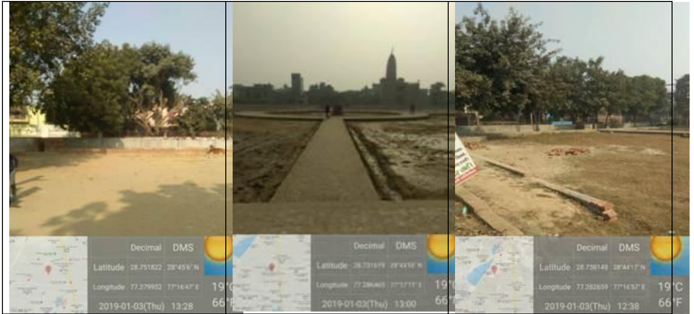
Image Amberkar Park 2016-17